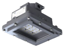
FLZW 415 - Plafonier